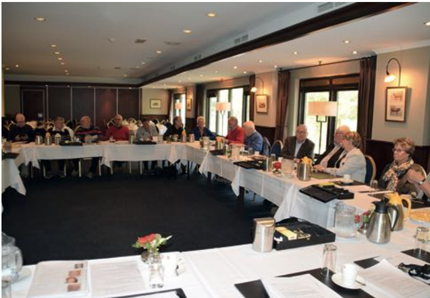
RCP-vergadering nieuwe stijl.

In Den Haag zijn verder enkele regio's opnieuw ingedeeld.